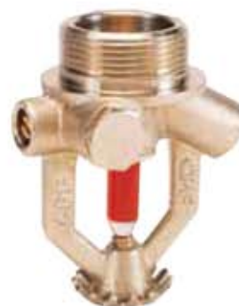
Bulbo standard 68 °C